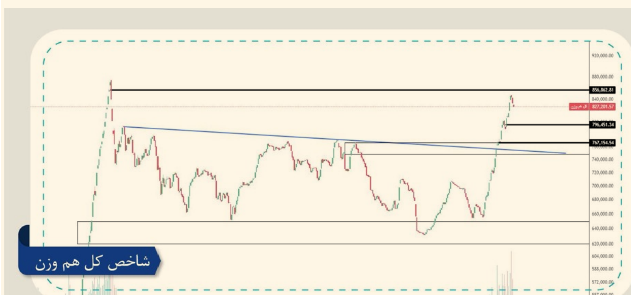
شاخص کل هم وزن

شاخص کل هم وزن را در چارت مقیاس لگاریتمی و تایم فریم روزانه مورد بررسی قرار دادیم: پس از رسیدن شاخص کل هم وزن به محدوده حمایتی حوالی ۶۳۰ هزار واحد، شاهد تشکیل الگوی سر و شانه بازگشتی بوده ایم. شاخص توانست مطابق با انتظار به نزدیکی مقاومت ۸۵۰ هزار واحدی خود برسد. مقاومت ذکر شده سقف تاریخی شاخص بوده که از نظر روانی مقاومت مهمی محسوب می شود. با توجه به واکنش منفی اولیه، مقاومت تایید شده است اما نواحی حمایتی پیش رو به ترتیب ۷۹۶ و ۷۶۷ هزار واحد است. با توجه به صعودی بودن ساختار شاخص، نواحی حمایتی از قدرت مناسبی برخوردار هستند. در صورتی که مجدداً وارد روند صعودی شویم و از سقف تاریخی عبور کنیم، اهداف شاخص آپدیت می گردد.