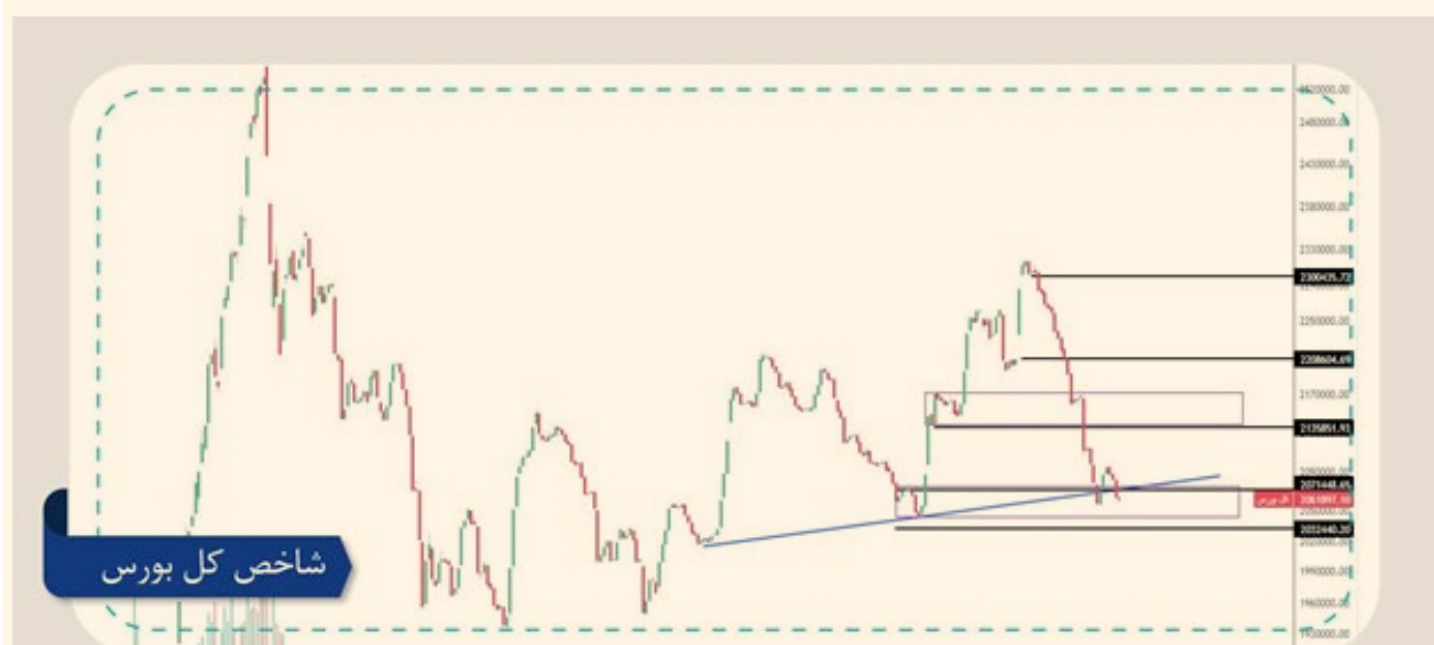
شاخص کل بورس

روند آبی، روند حاکم بر نوسانات چارت شاخص کل است که شیب ملایمی از نوسانات را نشان می‌دهد. اصلاح اخیر منجر به رسیدن شاخص به ناحیه ۲,۰۷۰,۰۰۰ واحد یعنی محدوده تشکیل پیوت صعودی قبلی که دارای همپوشانی با روند آبی بوده، شده است. با توجه به درجا زدن شاخص و واکنش اولیه شاخص به این ناحیه باید منتظر رفتار بعدی شاخص باشیم. در صورت رشد شاخص، هدف اول حوالی ۲,۱۳۰,۰۰۰ واحد است. برای اهداف بعدی نیاز به تثبیت بالای هدف اول داریم که در این صورت به ترتیب اهداف شاخص، ۲,۲۰۸,۰۰۰ و ۲,۳۰۰,۰۰۰ واحد خواهد بود. در صورت افت شاخص و تثبیت زیر ۲,۰۳۰,۰۰۰ دیدگاه فعلی نقض شده و شاخص نیاز به بررسی‌های بعدی دارد.