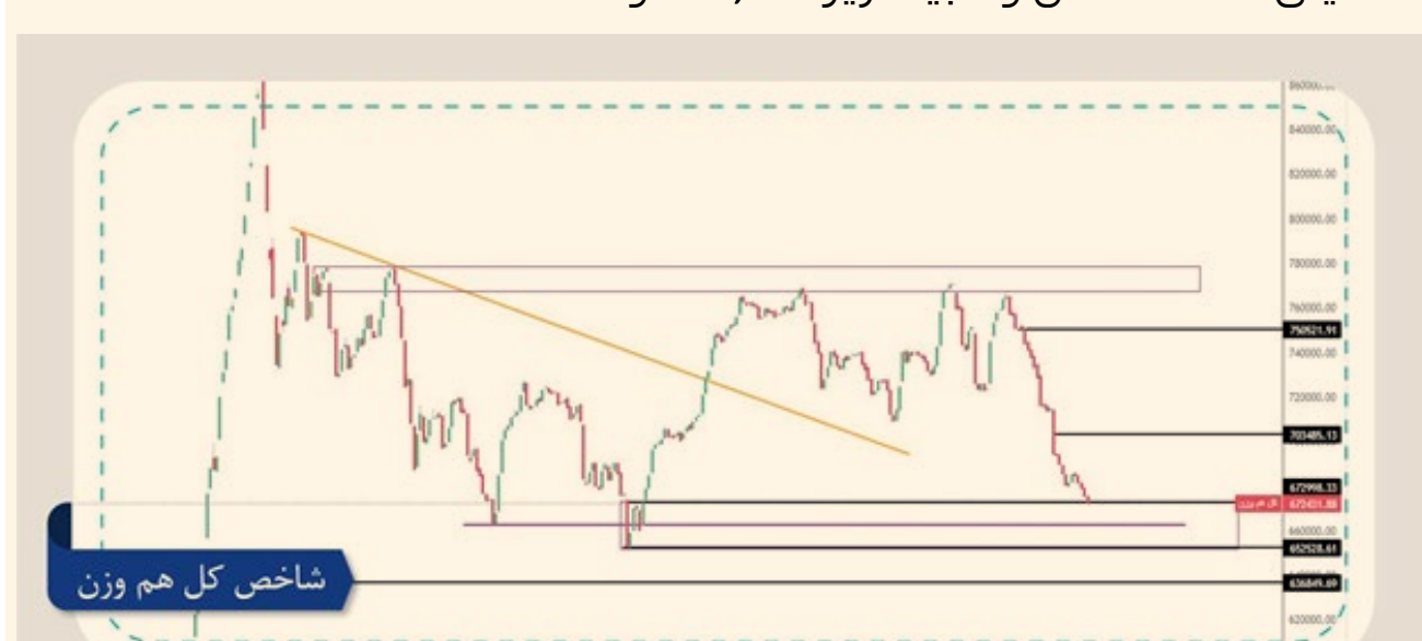
شاخص کل هم وزن

پس از شکسته شدن روند نزولی شاخص کل هم وزن (روند نارنجی) شاهد تثبیت خارج روند هستیم. شاخص پس از مدت‌ها نوسان درجا خارج از روند نزولی با افقی مواجه شده که شاخص را به محدوده منشا اصلی تصمیم گیری به شکست روند نزولی رسانده است. محدوده ۶۷۳,۰۰۰ تا ۶۵۲,۵۰۰ واحد ناحیه حمایتی بوده که اکنون شاخص کل هم وزن وارد این محدوده شده است. در این حالت به عنوان فعال بازار باید منتظر رفتار شاخص در مواجهه با این ناحیه حمایتی باشیم. در صورتی که واکنش مثبتی مشاهده شود، هدف اول حوالی ۷۰۳,۰۰۰ واحد خواهد بود. برای رشد بیشتر لازم است بالای هدف اول شاهد تثبیت شاخص باشیم که در این صورت هدف بعدی حوالی ۷۵۰,۰۰۰ واحد خواهد بود. حد ضرر دیدگاه تحلیلی، افت شاخص و تثبیت زیر ۶۳۶,۰۰۰ واحد است.