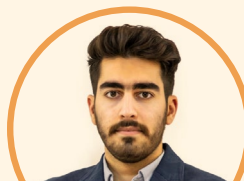
تحلیلگر: الیاس شریف بخش

نماد بفجر در حال تجربه افت قیمت است. با توجه به وجود روند صعودی نازجی، افت قیمت اخیر به منزله فرصتی برای ورود مناسب تر به سهم محسوب می‌شود. با توجه به ساختار چارت ۱۰۹۰، ۱۰۳۵ و ۹۸۷ تومان به ترتیب نواحی حمایتی هستند که در صورت رسیدن قیمت به هر کدام از آنها باید منتظر واکنش بفجر باشیم. قیمت اکنون در محدوده ۱۰۹۰ تومان که اولین محدوده حمایتی است، قرار دارد. در صورتی که شاهد بهبود تقاضا و رشد سهم و تثبیت بالای ۱۱۴۹ تومان باشیم، تاییدی برای صعود بیشتر از این محدوده حمایتی ایجاد شده و هدفی حوالی ۱۲۷۸ تومان خواهیم داشت. حد ضرر دیدگاه صعودی افت قیمت و تثبیت زیر ۹۴۱ تومان خواهد بود. با توجه به شرایط نواحی حمایتی، سهم را باید در واچ لیست قرار داده و با توجه به واکنش‌ها برای خرید یا فروش تصمیم‌گیری کنیم.