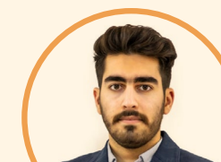
تحلیگر: الیاس شریف بخش

پس از شکسته شدن روند نزولی شاخص کل هم وزن (روند نارنجی) شاهد تثبیت خارج روند هستیم. شاخص پس از مدت‌ها نوسان درجا خارج از روند نزولی با افقی مواجه شده که شاخص را به محدوده منشا اصلی تصمیم گیری به شکست روند نزولی رسانده است. محدوده ۶۷۳,۰۰۰ تا ۶۵۲,۵۰۰ واحد ناحیه حمایتی بوده که اکنون شاخص کل هم وزن وارد این محدوده شده است. در این حالت به عنوان فعال بازار باید منتظر رفتار شاخص در مواجهه با این ناحیه حمایتی باشیم. در صورتی که واکنش مثبتی مشاهده شود، هدف اول حوالی ۷۰۳,۰۰۰ واحد خواهد بود. برای رشد بیشتر لازم است بالای هدف اول شاهد تثبیت شاخص باشیم که در این صورت هدف بعدی حوالی ۷۵۰,۰۰۰ واحد خواهد بود. حد ضرر دیدگاه تحلیلی، افت شاخص و تثبیت زیر ۶۳۶,۰۰۰ واحد است.