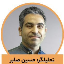
تحلیگر: حسین صابر